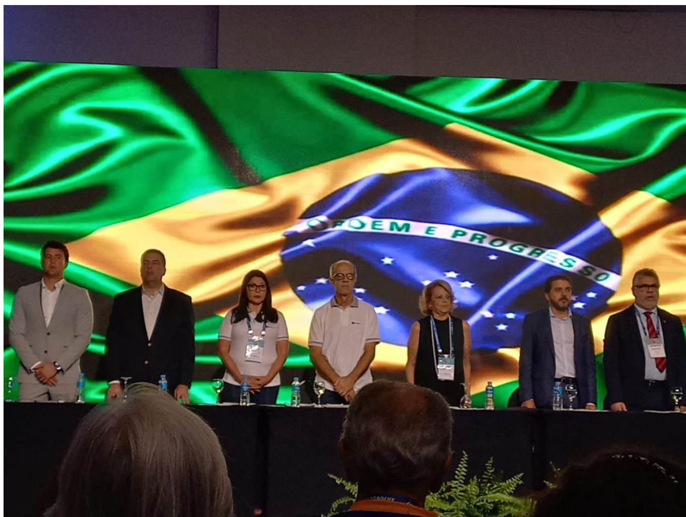
Mesa de abertura do evento