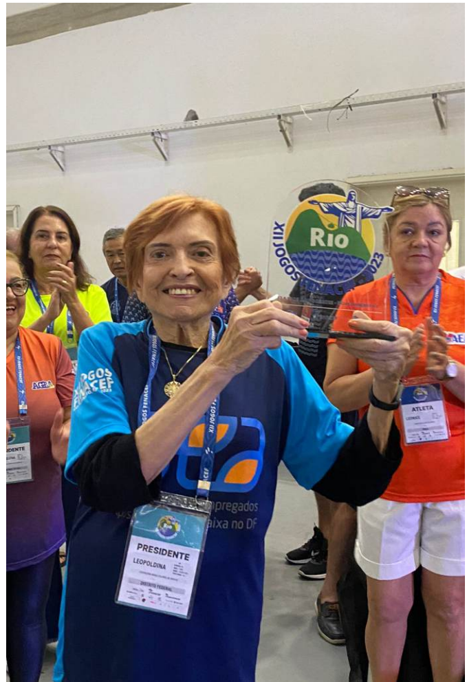
Flash da Alegria no Encerramento dos Jogos