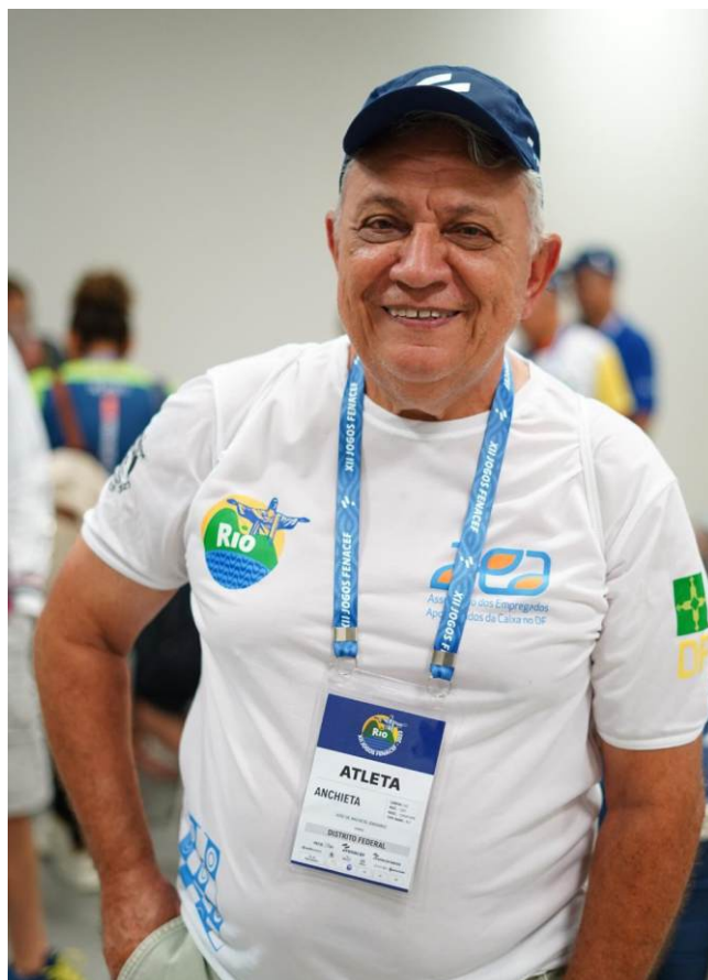
José de Anchieta Jerônimo - 1 Ouro