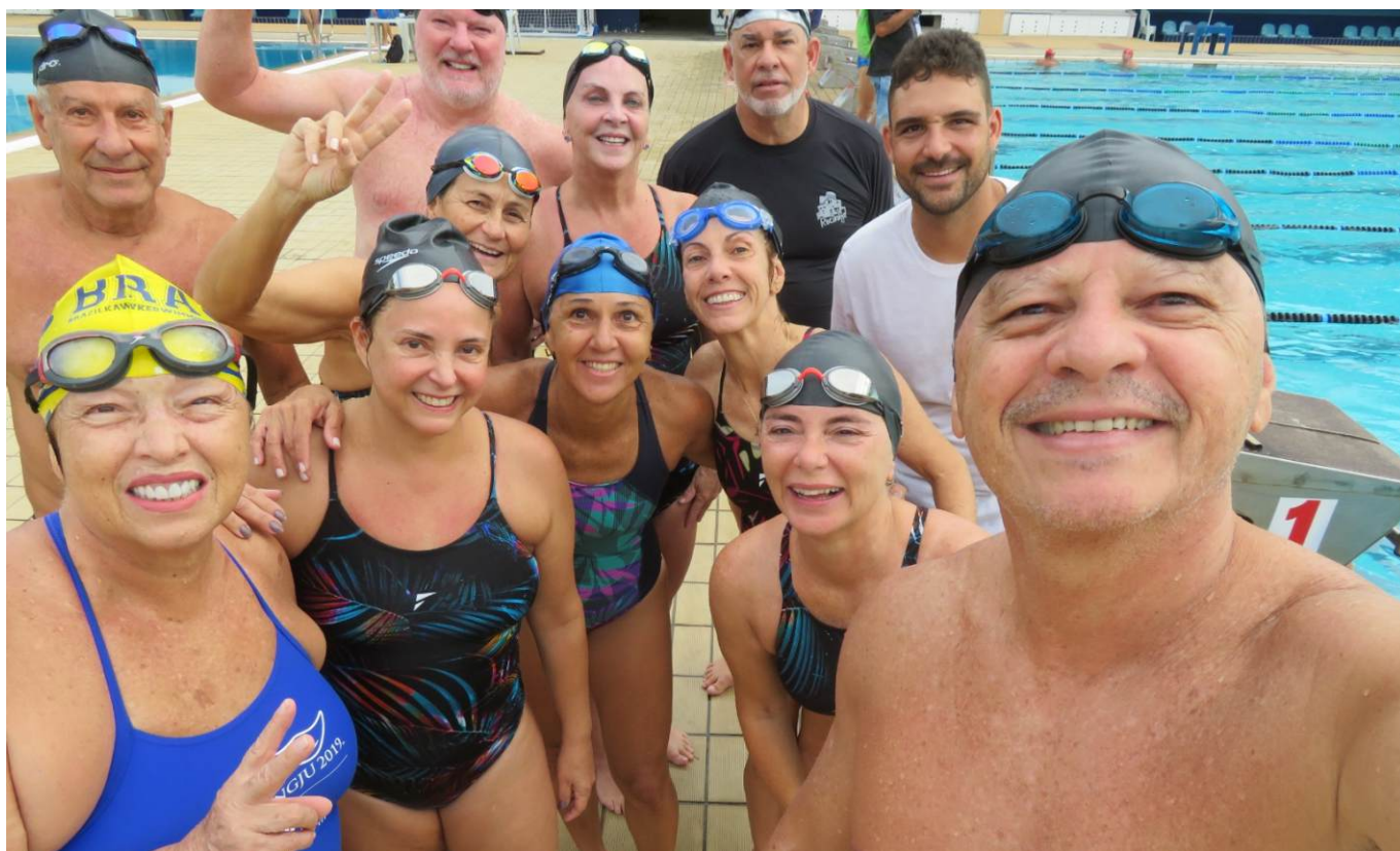
A equipe da Natação – 18 medalhas