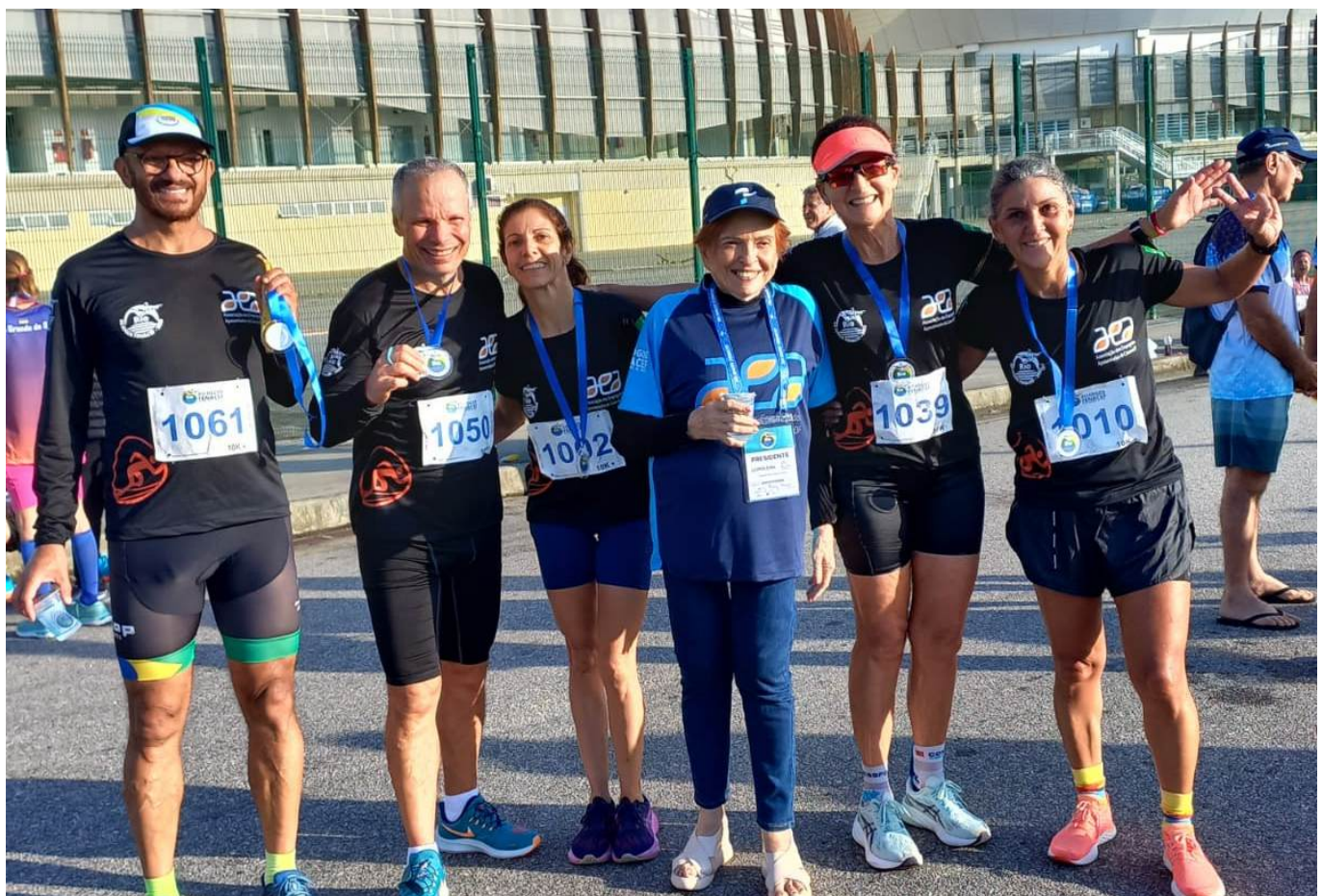
Corrida de Rua 10km