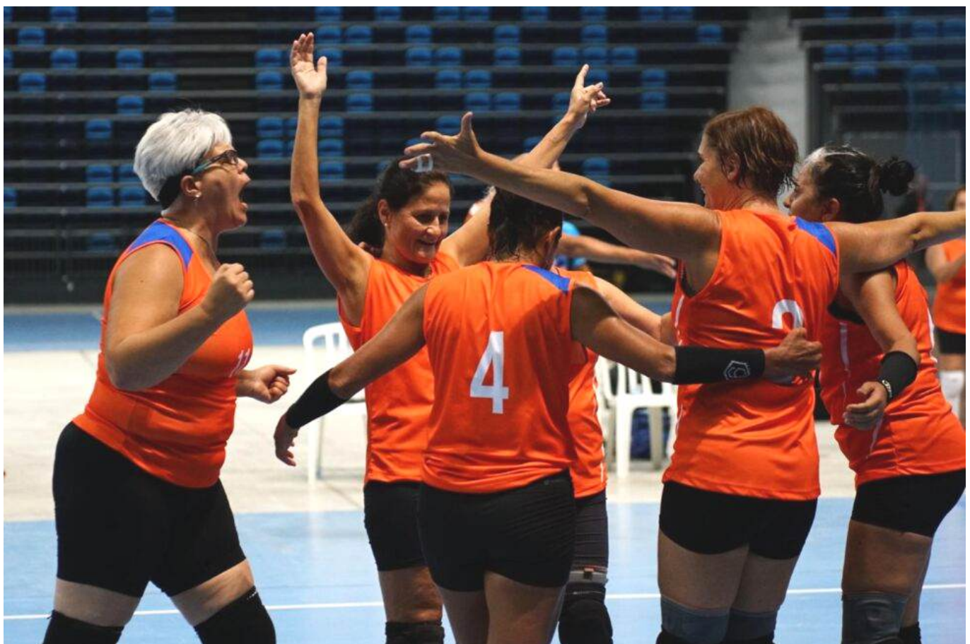
Time de Vôlei de Quadra Feminino - 1 Ouro - Foto Divulgação FENACEF