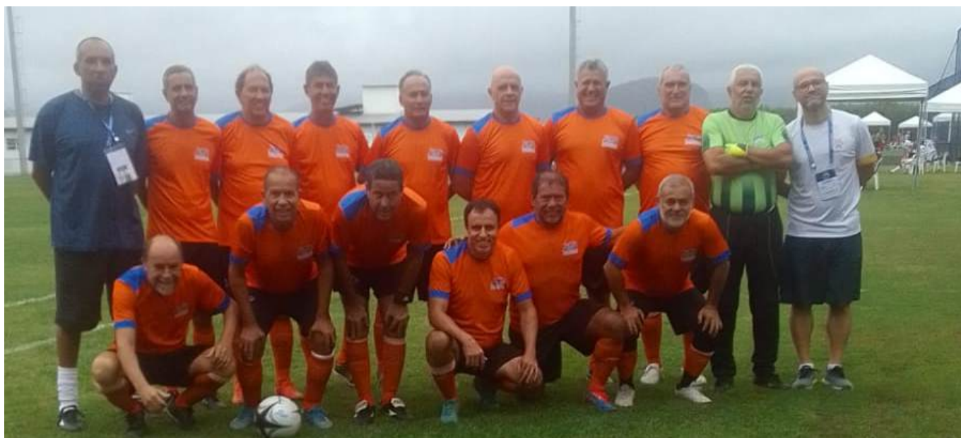
Time de Futebol Soçaito Livre