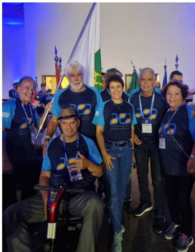
Representantes da AEADF no desfile de apresentação das delegações