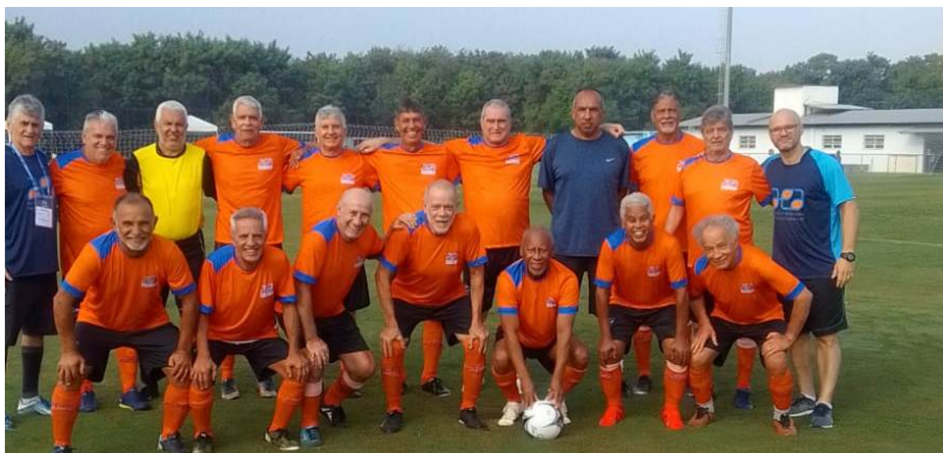
Time de Futebol Soçaite 65+

Participações em várias modalidades que não apenas valorizaram as conquistas, mas que demonstram o nível de esforço e dedicação dos atletas. Parabéns a todos.